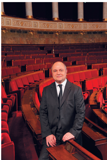
Bruno Le Roux

Président du groupe SRC Assemblée Nationale