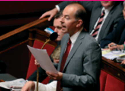
Assemblée Nationale © - 2008