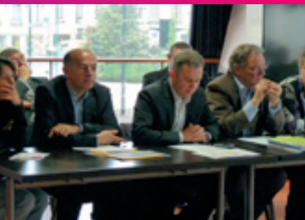
Conférence de presse pour la défense de l'éolien, avant le vote sur le projet de loi Grenelle 2 (Nantes, le 10 mai 2010)

Retrouvez l'ensemble de ses interventions dans la rubrique Travaux Parlementaires sur : www.michelmenard.fr